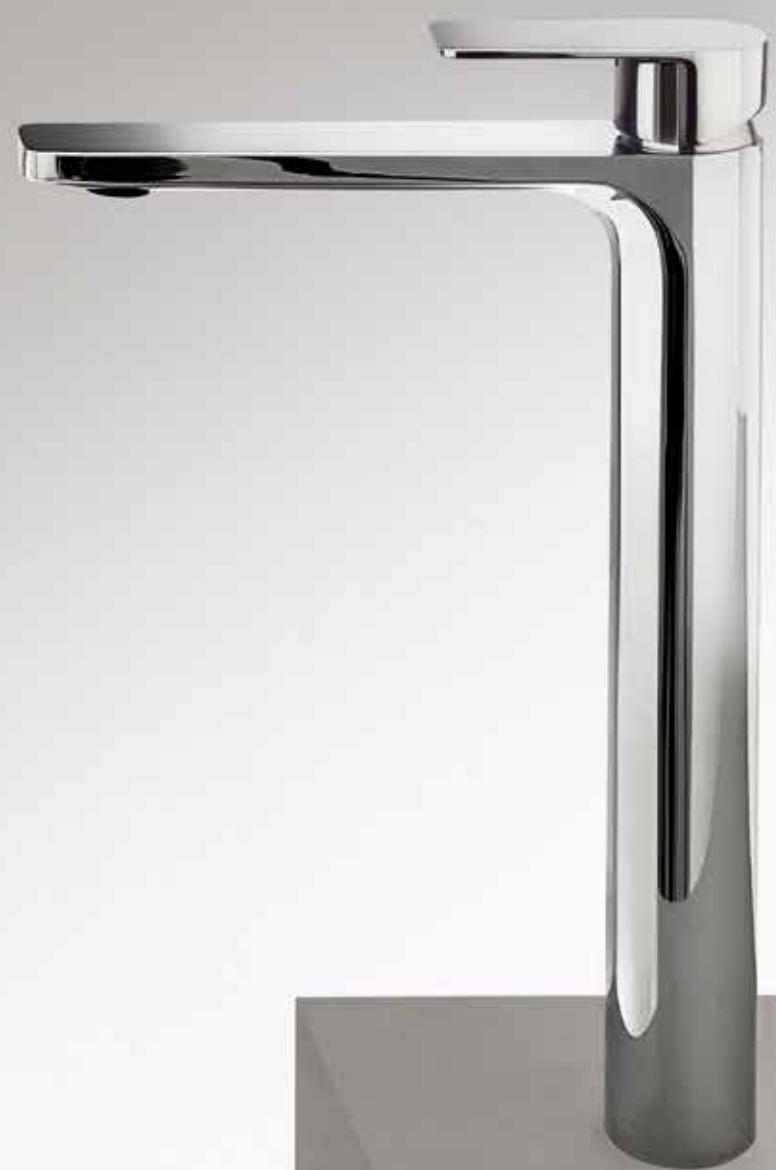
02 V606WF Miscelatore lavabo alto monoforo, cromo. Single-hole high washbasin mixer, chrome. Mitigeur lavabo surélevé monotrou, chromé. 1-Loch-Waschtischmischer hoch, Chrom. Monomando lavabo alto, cromo.